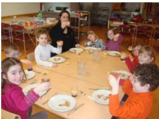
Dégustation de cocktails de fruits lors des dernières vacances d'hiver.

Un séjour nature à Neuwiller lès Saverne du 18 au 22 avril 2011 est organisé par l'accueil de loisirs de la Cabane (structure O.P.A.L). Au programme figureront des activités nature, des grands jeux et de l'escalade. Pour tout renseignement vous pouvez prendre contact auprès de la responsable de « Pomme de Pic ».