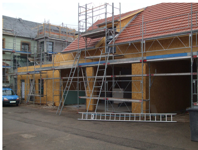
Extension des locaux techniques