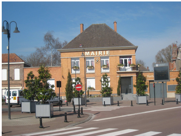
Mairie de Courchelettes.

Ce projet devra s'adresser à l'ensemble des habitants du village, qu'il s'agisse de simples rencontres dans le cadre de loisirs, ou d'échanges culturels et sportifs.