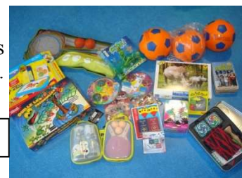
Jeux achetés grâce aux dons

Depuis le début d'année, le centre « Pomme de Pic », accueil périscolaire et de loisirs géré par l'OPAL, a pu, grâce aux dons du marché de Noël, acheter de nouveaux jeux. Choisis par les enfants fréquentant le centre, ils ont enrichi l'offre disponible.