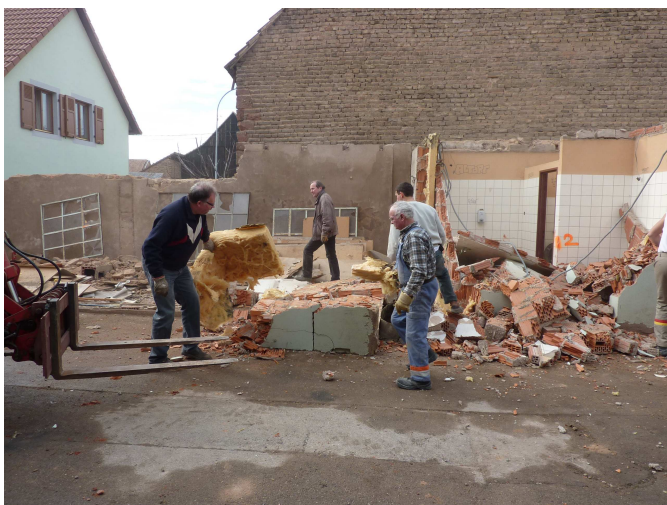
Démolition de l'ancien atelier réalisée par l'équipe municipale et des bénévoles